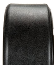
13 po lisse Polyrésine