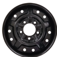
MSPN 49265 & 10545