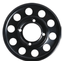
MSPN 21709 & 29242