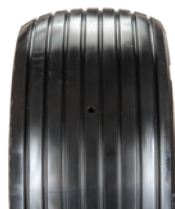
13 po rainurée Polyrésine