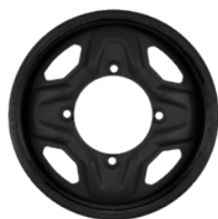
MSPN 75085 & 82599