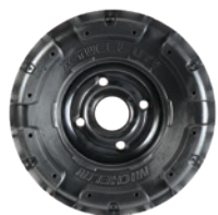
MSPN 68495, 67693, 65492, 64998 & 03488