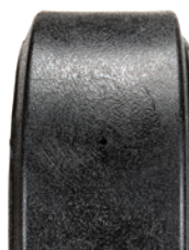
15 po lisse Polyrésine