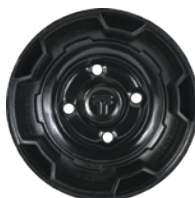
MSPN 01133 Pour voiturettes de golf (inclus le cap protecteur)