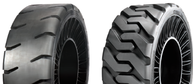
MSPN 45604 / CAI 976836 Traction sur surface dure