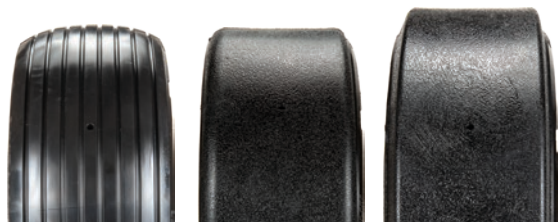
13" rainurée Polyrésine