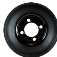
MSPN 78245 Pour véhicules utilitaires (Illustré ci-haut)